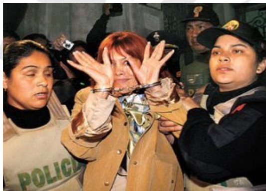
Magaly Medina llevada al penal.

La noticia generó mucha atención mediática y llegó a extenderse a medios internacionales. Este hecho generó que el programa Magaly Te Ve incrementase su sintonía y apostara por nuevos formatos. Lamentablemente, la fuerte competencia de otros programas originó que el programa de Magaly fuese perdiendo su sintonía, obligándola a poner fin a su programa en 2012 y darse una pausa para regresar años más tarde con otro formato diferente al que presentaba en ATV.