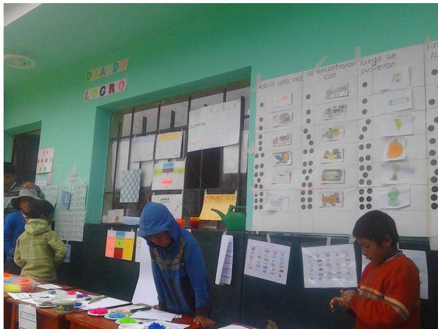
Niños de IE- 50678 exponiendo sus trabajos de producción de textos