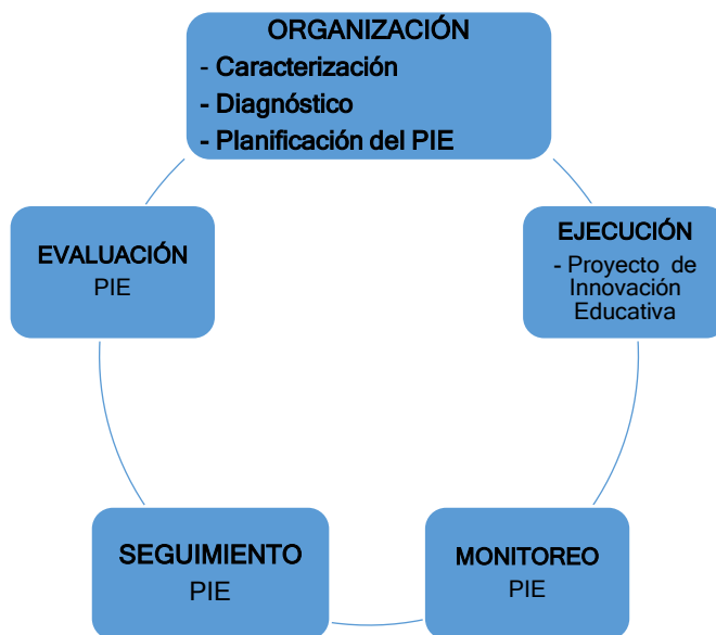
Gráfico N° 2

Las fases de implementación del proyecto: Organización, ejecución, monitoreo, seguimiento y evaluación.